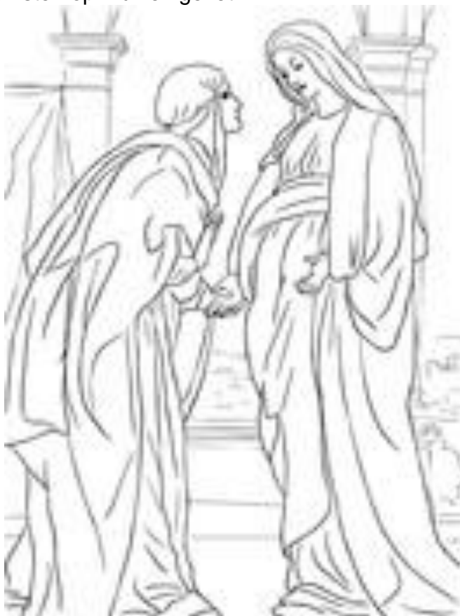
Kleurplaat Maria en haar nicht Elisabeth

Het Magnificat is door verschillende beroemde componisten op muziek gezet.